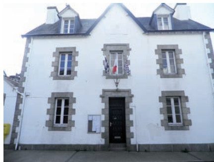
Mairie annexe de Lanriec