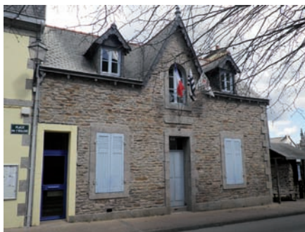
Mairie annexe de Beuzec-Conq

La gestion des deux cimetières est aussi assurée dans les Mairies-Annexes : achat de concessions ou demandes de renouvellement.