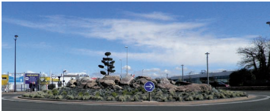
Rond-point de Maison blanche en cours d'aménagement

Sur la seconde partie de l'aménagement, les services ont voulu attirer l'attention sur les paysages intérieurs de notre région Bretagne, l'élément principal utilisé étant le schiste, qui rappelle le Massif Armoricain.