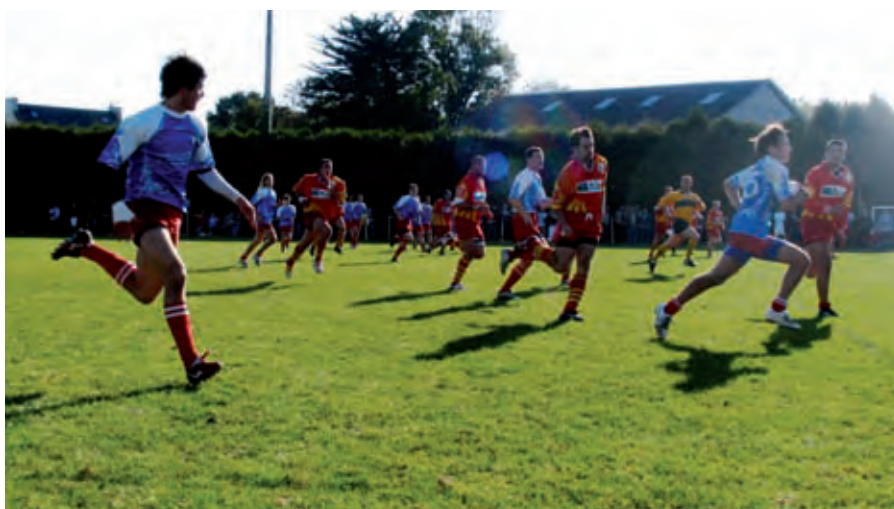
De nouvelles ambitions pour l'équipe fanion.

Les terrains ont été viabilisés dès l'été 2009. Les installations sont en cours de réalisations. Une certitude : l'ensemble sera opérationnel pour la saison 2009 – 2010. Les dirigeants du club continuent de caresser un rêve secret. Visant les play-off pour la montée en Fédérale 3, ils verraient d'un très bon œil de pouvoir jouer au mois d'avril leurs premiers matchs inauguraux... À suivre. ■