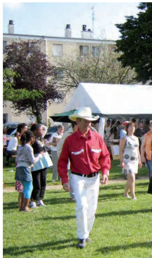
Animations et stands ont connu un joli succès pour

Dans le cadre du CUCS, l'équipe d'animation s'est associée, fin août, à l'association des “Petits débrouillards Bretagne”, afin de proposer des animations gratuites aux enfants de plus de huit ans. Équipés de matériel vidéo et d'un appareil-photo numérique, ils ont réfléchi à l'aménagement d'un quartier idéal et fait des propositions d'amélioration.