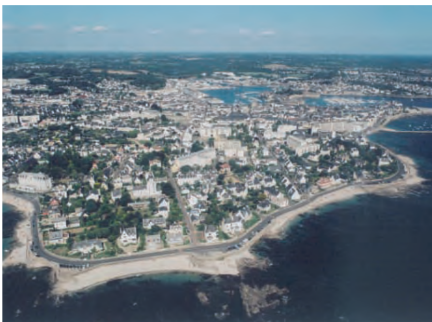
Des questions à résoudre à l'échelle de la ville.

En outre, le rapport met en lumière un manque de communication et de coordination entre l'ensemble des services, qu'ils soient publics ou privés. Or, pour que les actions de prévention gagnent en efficacité, l'ensemble des