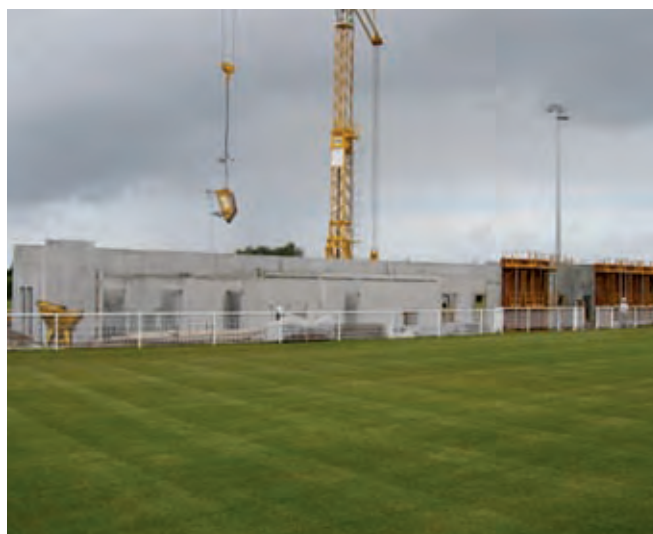
Changement de standing pour le RCC.

Depuis le temps qu'ils l'attendent, les membres du Rugby Club Concarnois ne dissimulent pas leur impatience de pouvoir enfin se produire sur le terrain du Vuzut. Le nouveau stade implanté sur une surface de près de 60 000 mètres carrés devrait être l'un des plus beaux de Bretagne. Une amélioration qui va de pair avec les nouvelles ambitions du club.