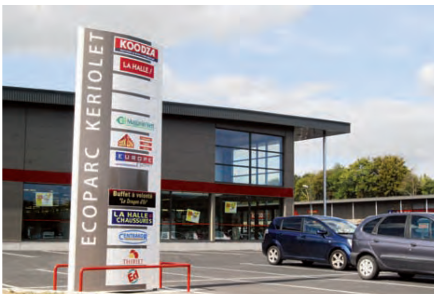
Mieux identifier les vocations des zones d'activité.

ayant besoin d'un effet de vitrine lié à la proximité de la voie express et de l'échangeur de Concarneau. Elle héberge déjà deux entreprises, Cornouaille Laser et Hélias Transport, et trois autres sont en passe de s'installer. La Ville va donc investir près de 370 000€ pour accueillir d'autres entreprises et per-