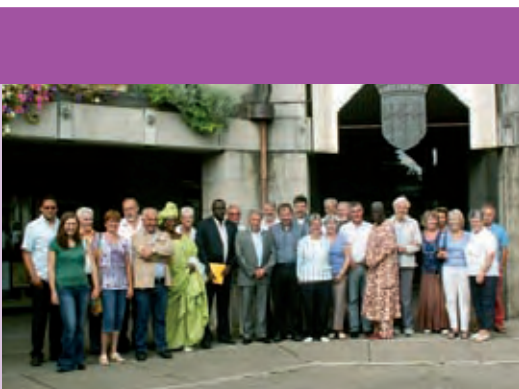
Les trois délégations du jumelage Penzance, Bielefeld-Senne, MBour, reçues en mairie au mois d'août dernier.

C'est le même souhait d'ouverture qui pousse la municipalité à inciter ses animateurs à se perfectionner dans les langues de Shakespeare et de Cervantes. L'association locale, LAC (Language Arts Center) les accompagnera dans ce projet linguistique.