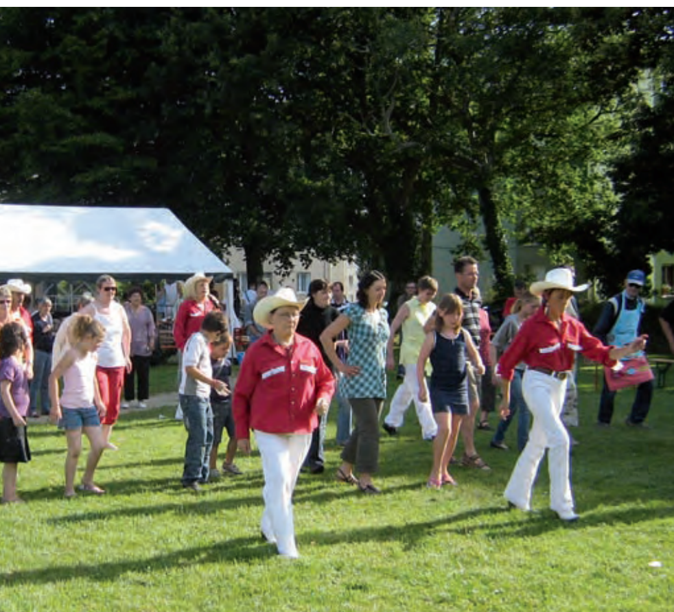
La 2 e édition de “Kerandon en fête”, le 5 juillet dernier, comme en témoigne la soirée country.