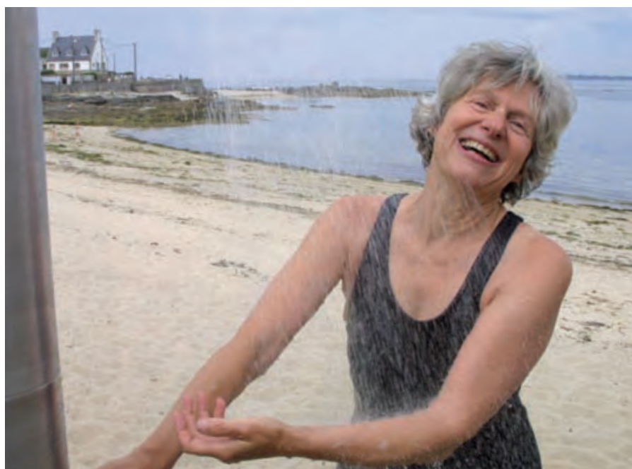
Été pluvieux mais chaleureux.

Souhaitons une saison 2010 meilleure encore, le tourisme restant un des piliers de notre économie locale. ■