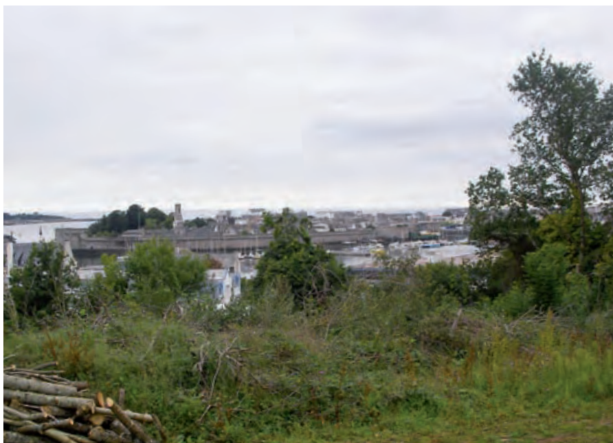
Kercorré : une vue exceptionnelle.

Le souhait de la municipalité est de regrouper ces zones sous une dénomination unique "Pôle commercial de la Maison Blanche". Cette globalisation, qui sera accompagnée d'une signa-