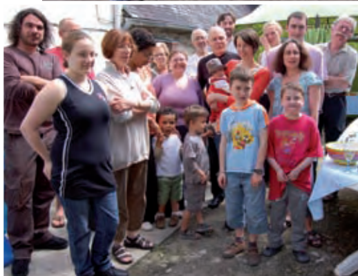
Au centre ville comme au Lin, la fête des voisins séduit.