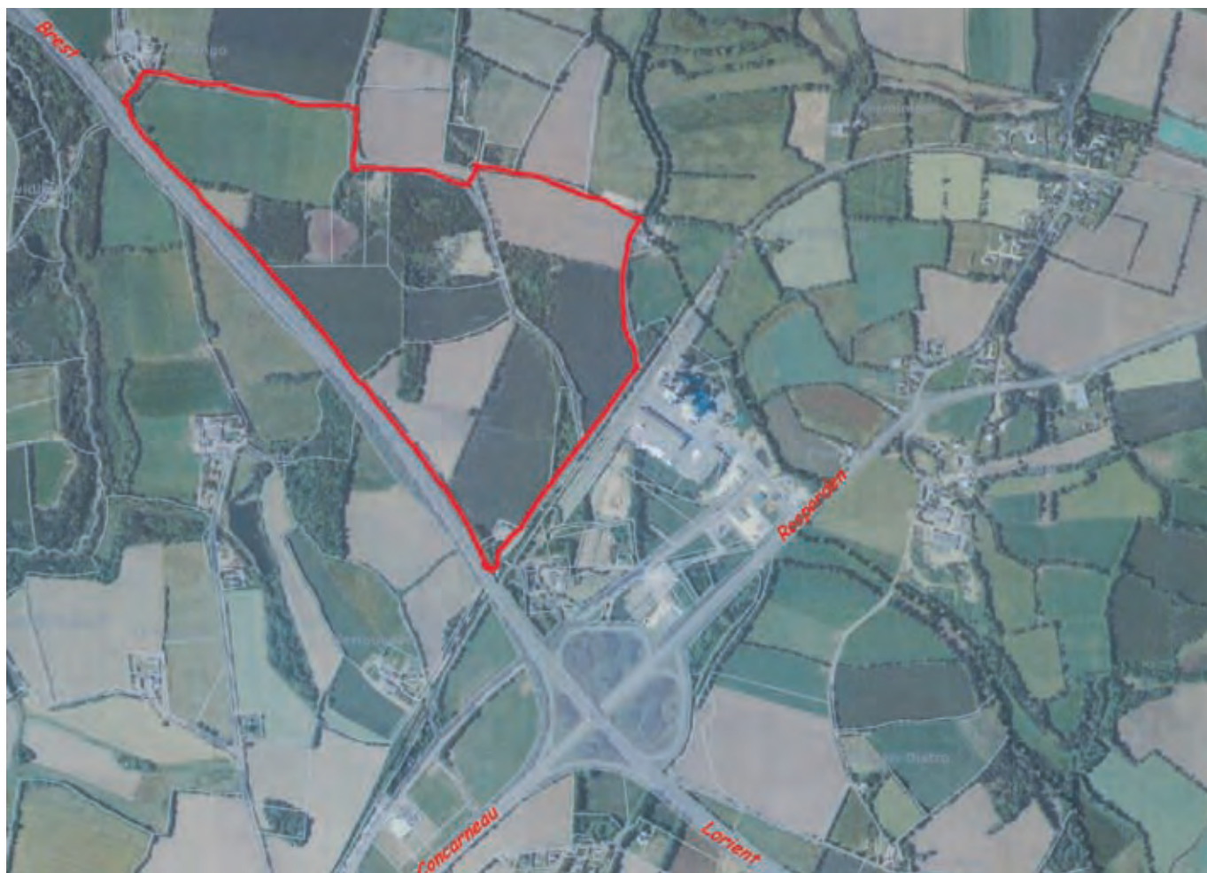
Coat-Conq : lancement d'une étude en vue de la réalisation d'un pôle logistique.

Le club devra contribuer à diffuser de l'information et à faire circuler des